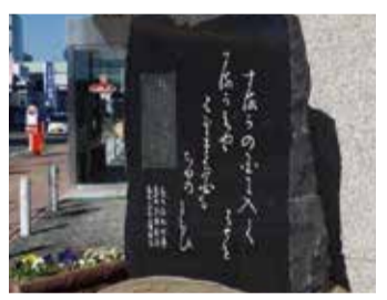
句碑 芭蕉翁駿河路や句碑 「するがぢや花橘も茶のにはい」元禄7（1694）年5月に塚本如舟宅に逗留した際に詠んだ句と考えられる。

島田市は、かつては大井川の川留めにより、旅人が長く滞在した宿場町でもあります。かの有名な俳人「松尾芭蕉」も四日間滞在し、多くの句を残しています。和菓子店が多くある本通にも、句碑が多数設置されています。和菓子巡るついでに、東海道の旅人のように島田を巡ってみてはいかがでしょうか。