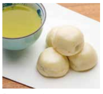
「清水屋 本店」小まんじゅう 島田の和菓子店で多く取り扱われる銘菓。小まんじゅうのルーツは清水屋にあり。

島田駅前の「清水屋」です。江戸時代、東海道の旅人が川留めで滞在した際に親しまれた和菓子の一つとして「小まんじゅう」の記録が残っています。昔は一般的なおまんじゅうのサイズでしたが、松江のお殿様のアドバースによりつまみやすいサイズになったと言われています。